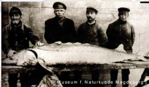
© Museum f. Naturkunde Magdeburg ) En stør fanget i Østersøen i starten af det 20'ende århundrede (c Museum of Natural History, Magdeburg, Tyskland).

Støren er et levende fossil, som har eksisteret i over 200 millioner år. Herved har den overlevet dinosaurerne. Indtil slutningen af det 19. århundrede har den været en vigtig del af fiskefaunaen i alle større floder og kystnære vande i den sydlige del af Østersøen. Hvor den end forekom, havde den en bemærkelsesværdig indflydelse på de mennesker, der levede der. Øget forurening og Hydrokonstruktioner, har forringet dens levesteder. Tilsvarende påvirkninger er også blevet observeret for andre vandrende fiskearter. Overfiskeri af voksne formeringsdygtige individer iscenesatte størens udryddelse i midten af det 20'ende århundrede.