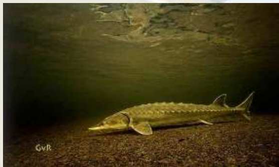
Baltic-sturgeon Acipenser oxyrinchus

HELCOM har støttet genetableringen af stør siden 1997 og har bl.a. inkluderet mål for forvaltningen af stør i HELCOM's Biodiversitetsprogram.